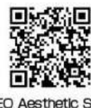
NEO Aesthetic Salon