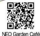
NEO Garden Café