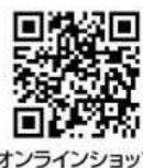
オンラインショップ