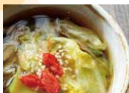
スープはもちろん! 普段のお料理にも!