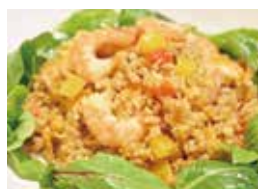
小海老とパプリカの 薬膳玄米チャーハン