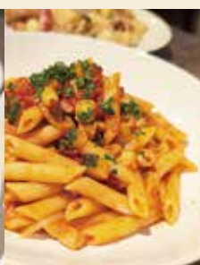
●本日のペンネ アラビアータ