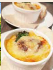
●豆腐とミートソース のチーズ焼