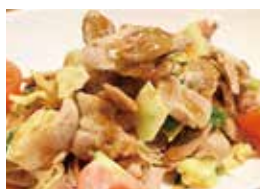
豚肉と野菜の 薬膳生姜焼