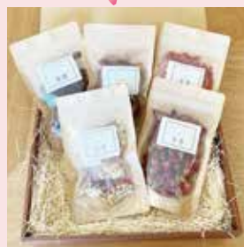
OUCHIde 薬膳 ギフトセット なつめ・クコの実・リュウガンニク マイカイカ・薬膳