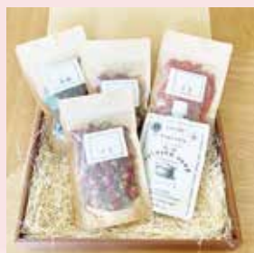
OUCHIde 薬膳 ギフトセット なつめ・クコの実・リュウガンニク マイカイカ・薬膳スープ