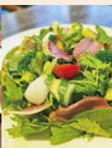
●いぶし鴨と 季節野菜のサラダ