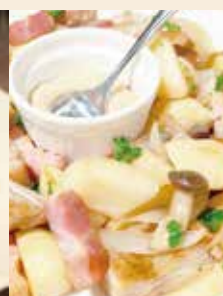
●チキンの ジャーマンポテト