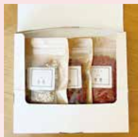
OUCHIde 薬膳 ギフトセット クコの実・マイカイカ・薬膳

美容や健康に良いと人気の薬膳食材を、 初めての方でも取り入れやすい 小分けにしました。 毎日のお料理やお茶などにも使えて、 とっても便利!ご自身はもちろん、 ご家族やご友人など、健康を気遣う 大切な方への贈り物として とても人気のギフトです。