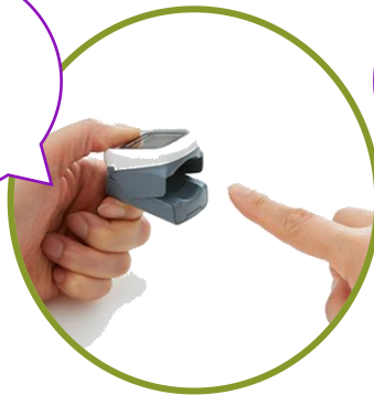
血中酸素飽和濃度