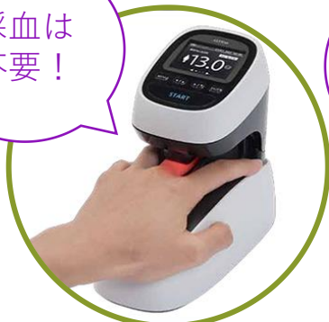
血中ヘモグロビン