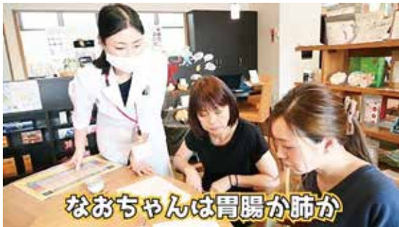
なおちゃんは胃腸か肺か